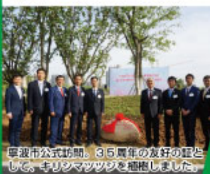
摩波市公式訪問。35周年の友好の証として、クリスマスツツジを植樹しました。