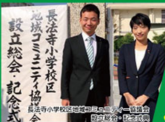
長法寺小学校校区 地域コミュニティ協議会 設立総会・記念式