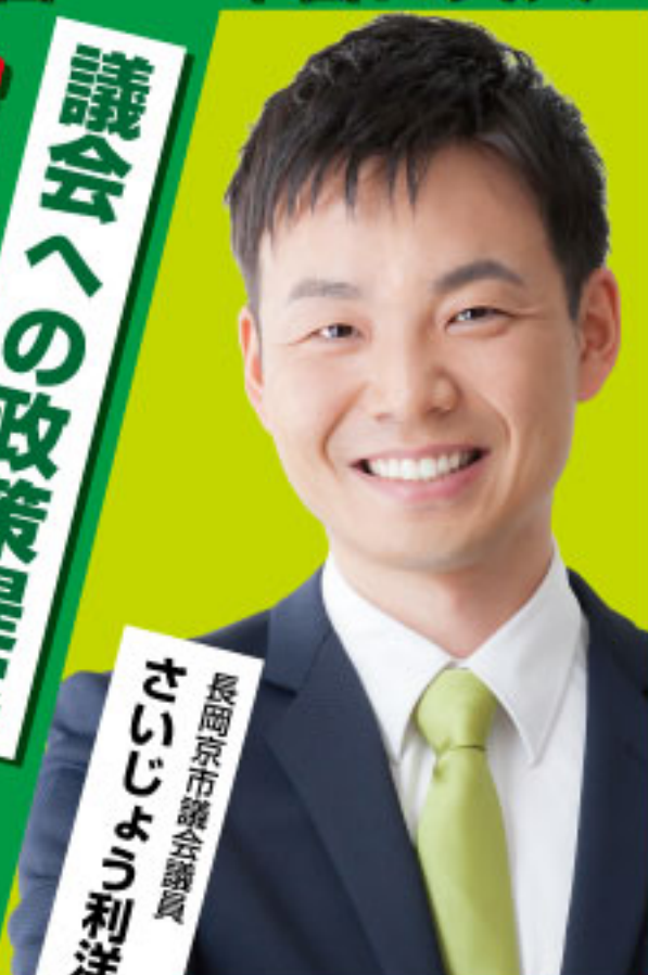
長岡京市議会議員 さいじょう利洋